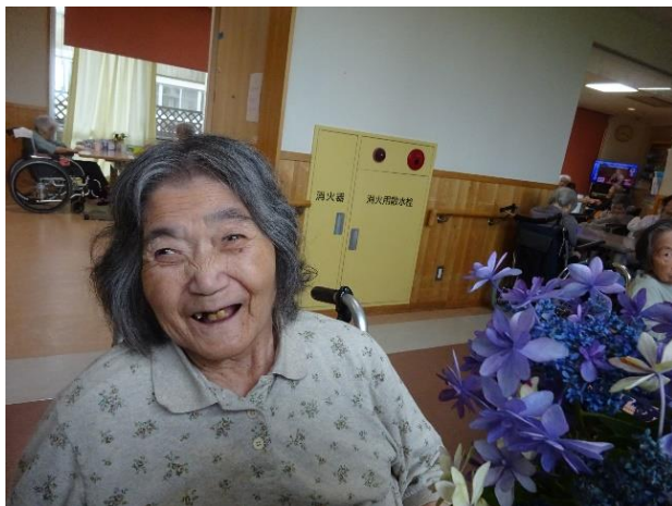
苑庭に咲いた紫陽花と