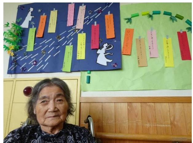
七夕の短冊を書きました