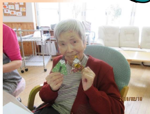
ひな祭りに向けて 雑飾りを作成しているところです