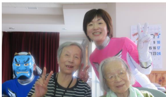
鬼も福娘も みんな優しかったなあ