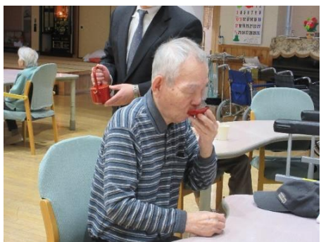
元旦恒例行事 お神酒