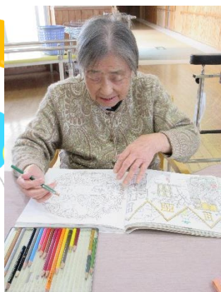
輪投げ・もぐらたたき ぬりえ・外気浴