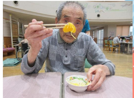
おやつ作り (そうめん)

写真はありませんが、 入居者・ショートステイの方が集まり、 合同行事(4・5月誕生会)も行いました。 少しずつ、行事も再開していきます。